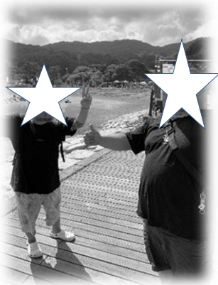
応援団たち。来年は出場するぞ!