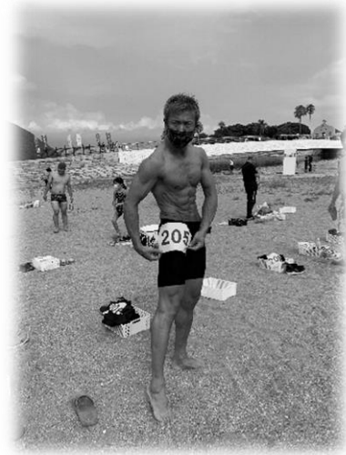
体は優勝!!おめでとう!