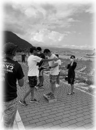
サトシさんが2位になりました!