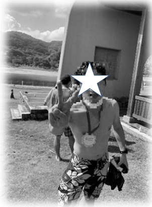
去年の自分を超えたぜ!!!